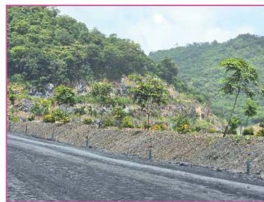
แนวคันทำนบกั้นดิน