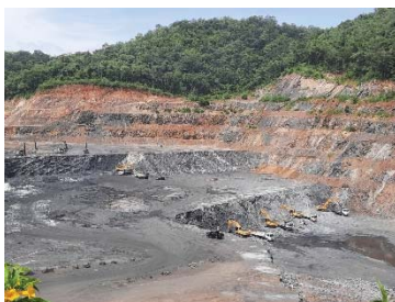
หน้าเหมืองของโครงการ