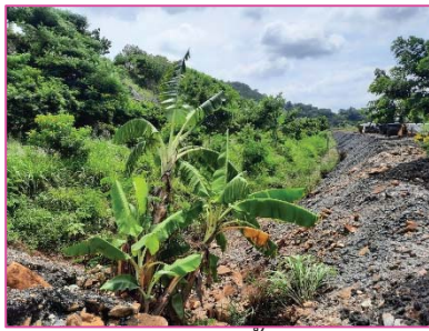
กระบายน้ำ