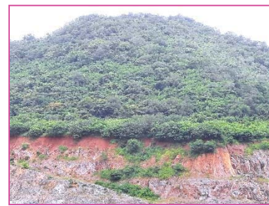
พื้นที่ที่ไม่มีการทำเหมือง