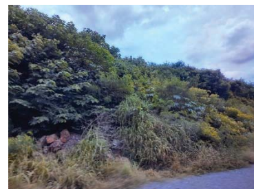
แนวต้นไม้ภายในโครงการ