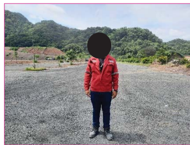
พนักงานสวมใส่อุปกรณ์ป้องกันอันตราย