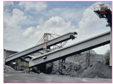
การปิดคลุมโรงโม่หินของโครงการ