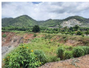
ต้นไม้บนคันทำนบกั้นดิน