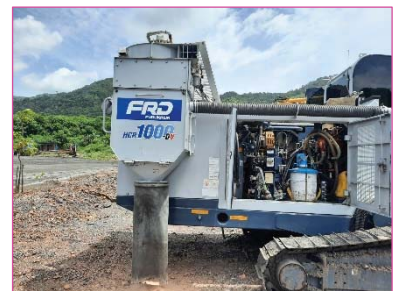
การปิดคลุมเครื่องเจาะระเบิด