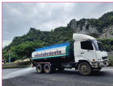
รถบรรทุกฉีดพรมน้ำ