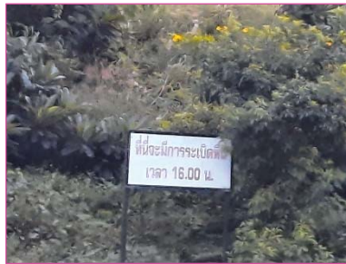
ป้ายเตือนเขตการใช้วัตถุระเบิด